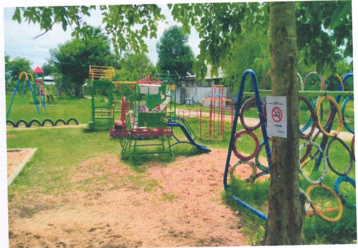
ลานสนามเด็กเล็กเล่น