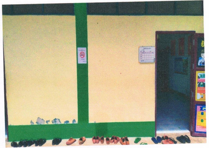
โรงเรียนวัดบ้านหนองตลุมพุก